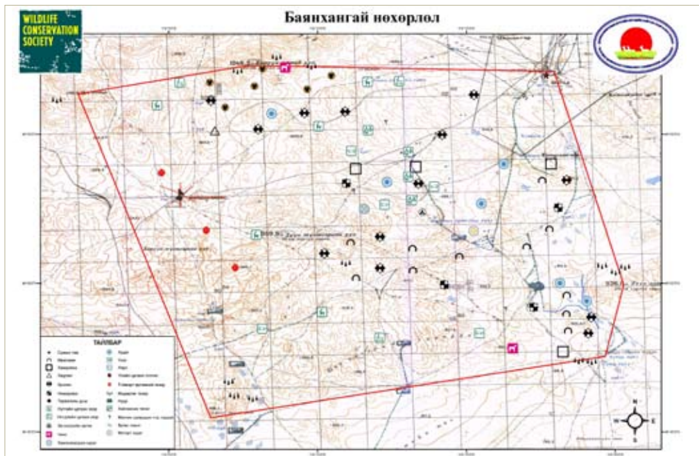
Зураг 1. Баянхангай нөхөрлөлийн бүүдүвч зураг байгуулах дасгал